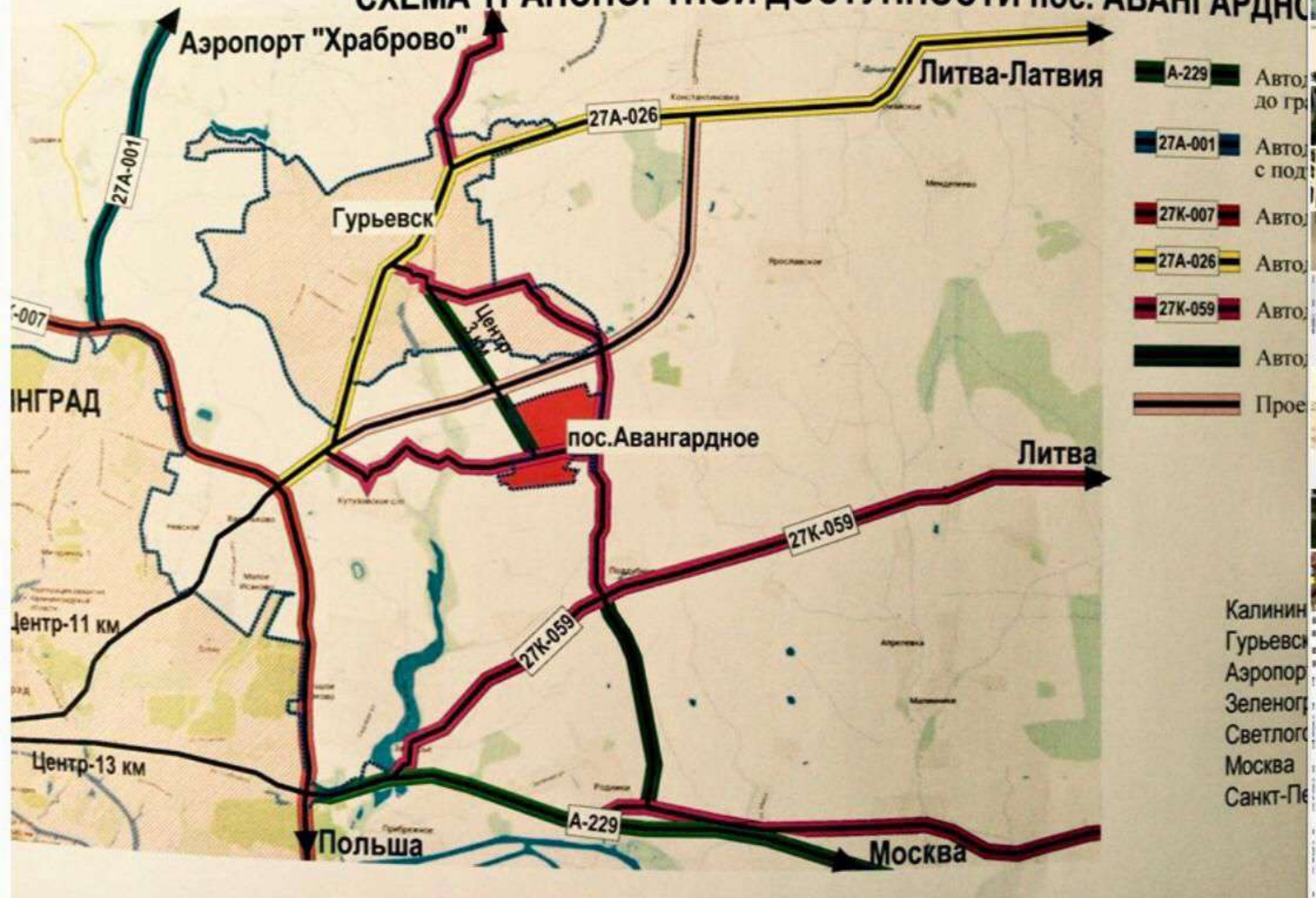
СХЕМА ТРАНСПОРТНОЙ ДОСТУПНОСТИ пос. АВАНГАРДНОЕ